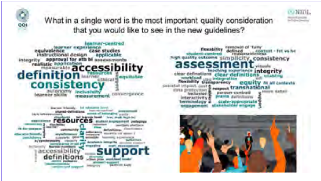
Fíor 1. Aiseolas le linn seisiúin éisteachta comhairliúcháin le páirtithe leasmhara

Le linn chéim forbartha na dtreoirlínte, tugadh roinnt cur i láthair comhdhála chun dul chun cinn a chomhroinnt, táscairí cáilíochta a bhailíochtú agus aiseolas a lorg ón earnáil, lena n-áirítear páipéir ag Comhdháil na hÉireann um Rannpháirtíocht na hOideolaíochta 38 i mí na Nollag 2022, Comhdháil Gheimhridh EdTech Eanáir 2023 39 arna óstáil ag Cumann Teicneolaíochta Foghlama na hÉireann (ILTA) agus Comhdháil Bhliantúil Foghlaim Dhigiteach EDEN na hEorpa 40 i Meitheamh 2023.